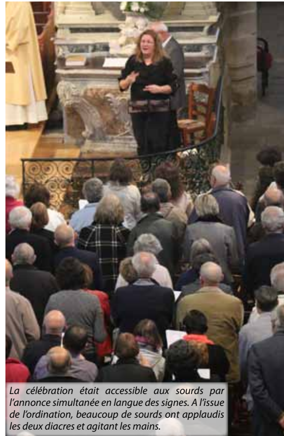
La célébration était accessible aux sourds par l'annonce simultanée en langue des signes. A l'issue de l'ordination, beaucoup de sourds ont applaudis les deux diacres et agitant les mains.

La lettre de mission m'envoie comme diacre accompagnateur de la pastorale des sourds du Morbihan, en devenant membre de l'équipe pastorale de la paroisse Cathédrale. C'est donc avec grande joie que je reçois cette lettre car je pourrai à la fois continuer à être simple serviteur du Seigneur pour la beauté de la liturgie par l'accompagnement musical mais avec aussi par cette nouvelle mission de l'annonce de la Parole de Dieu à ceux qui ne peuvent l'entendre.»