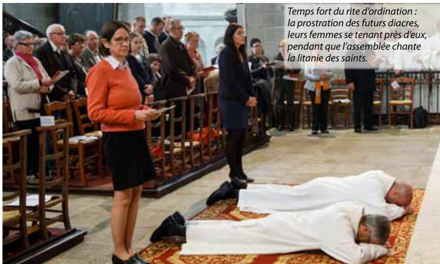
Temps fort du rite d'ordination : la prostration des futurs diacres, leurs femmes se tenant près d'eux, pendant que l'assemblée chante la litanie des saints.