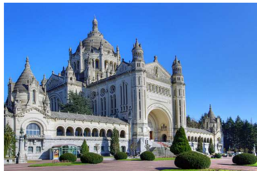
Basilique Notre Dame de Lisieux