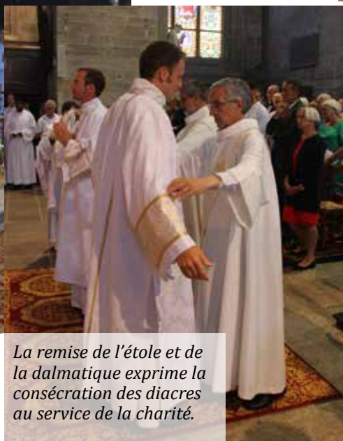
La remise de l'étole et de la dalmatique exprime la consécration des diacres au service de la charité.