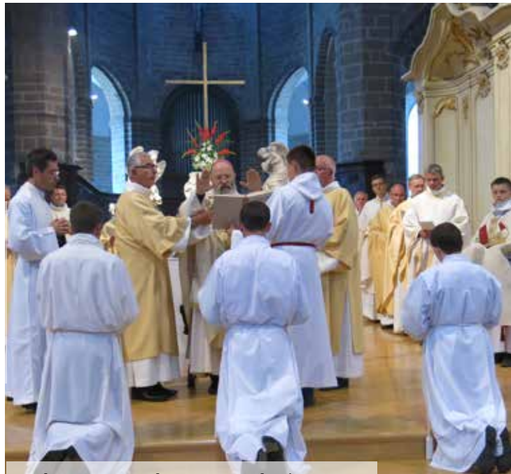
En leur imposant les mains sur la tête, l'évêque communique aux ordinands le don de l'Esprit-Saint pour la charge diaconale.