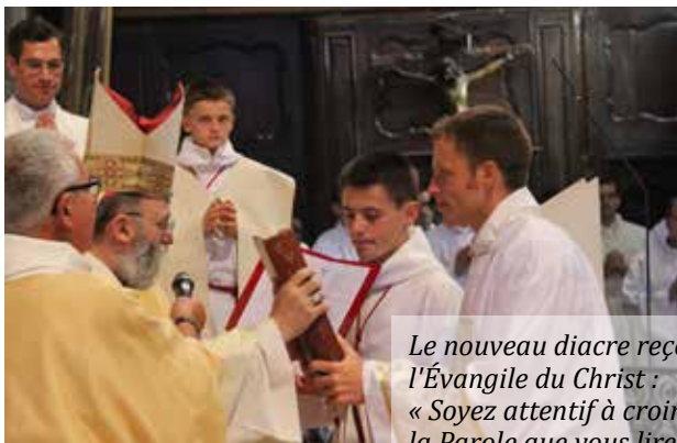
Le nouveau diacre reçoit l'Évangile du Christ : « Soyez attentif à croire à la Parole que vous lirez, à enseigner ce que vous avez cru, à vivre ce que vous aurez enseigné ».