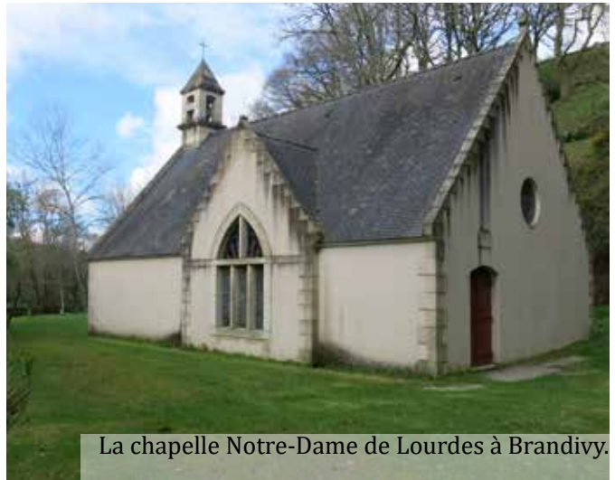
La chapelle Notre-Dame de Lourdes à Brandivy.

Nous pensons tous aux nombreuses réalisations d'Ambroise, mais sa vie aussi était parlante mal-