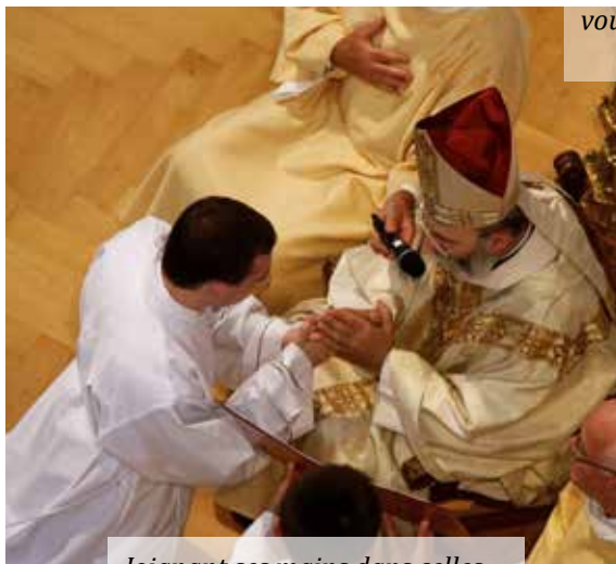
Joignant ses mains dans celles de l'évêque, le candidat promet de vivre en communion avec lui et ses successeurs.