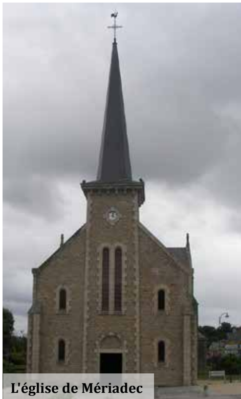
L'église de Mériadec