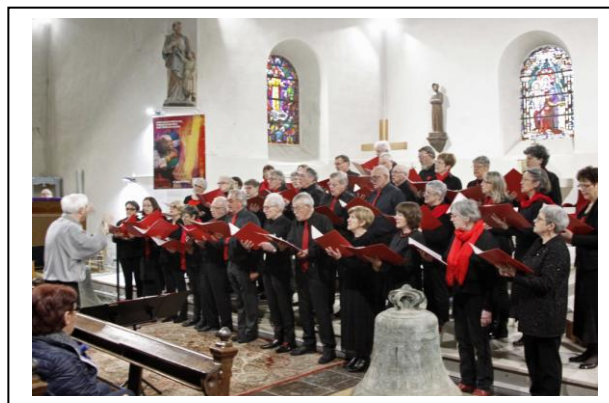
Le Chœur de Ploemel