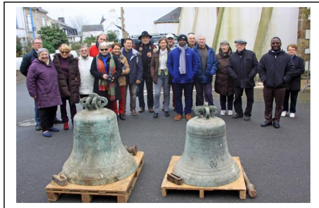
Les cloches « Rosalie » et « France » à terre

La société Art Camp, spécialisée en Art campanaire et en travaux acrobatiques a procédé à l'extraction des cloches par l'emplacement des abat-sons démontés pour l'occasion.