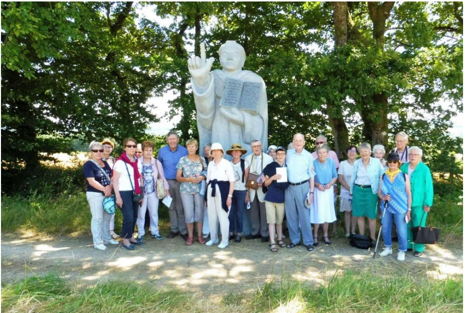
Quelques pèlerins entourant la statue de Saint Vincent Ferrer