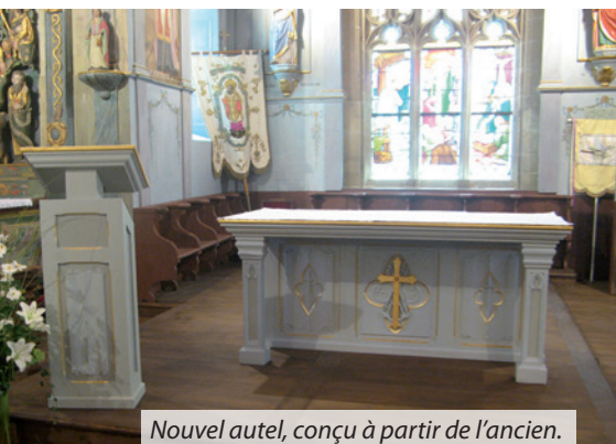
Nouvel autel, conçu à partir de l'ancien.

Le dimanche 31 août, Mgr Centène a consacré le nouvel autel de l'église de Saint-Aignan. Après plus d'un an de travaux, le chœur de l'église entièrement restauré accueille son nouvel autel. Conçu à partir de l'ancien, mais aménagé dans de nouvelles dimensions, il s'intègre au magnifique décor de retables de l'église qui lui sert d'écrin.