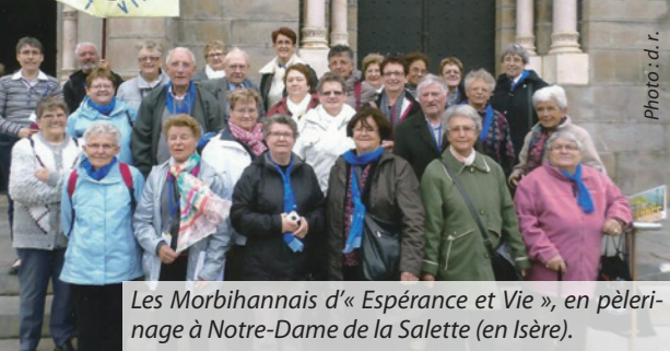
Les Morbihannais d'« Espérance et Vie », en pèlerinage à Notre-Dame de la Salette (en Isère).