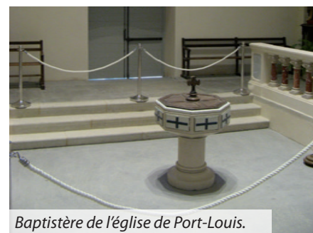
Baptistère de l'église de Port-Louis.

André Mériel-Bussy (1902-1984) a travaillé dans quelques églises du diocèse de Vannes : fresque et chemin de croix Saint Pie X à Vannes, fresques du baptistère de l'église d'Arradon, église de Pleugriffet.