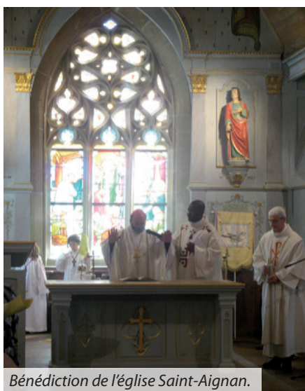
Bénédictio de l'église Saint-Aignan.

La commission diocésaine d'Art Sacré est heureuse de voir aboutir des projets de création et de restauration engagés depuis plusieurs mois.