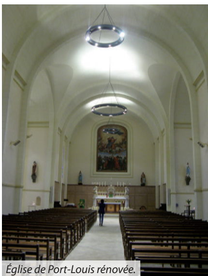
Église de Port-Louis rénovée.