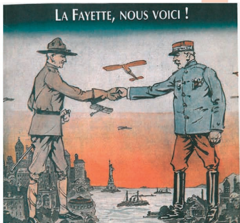
Couverture de la partition « Good bye Broadway, Hello France » 1917 : Pershing et Joffre sont placés sur un pied d'égalité.

Le 4 juillet 1918, leur fête nationale « Independence day » est célébrée superbement à