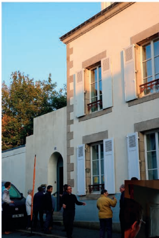
Au 29 rue Leperdit, à Pontivy, la Maison est placée sous le patronage de la bienheureuse Chiara Luce. (cf biographie ci-contre)

L'évêque du diocèse d'Acqui qui l'avait confirmée et l'avait rencontrée plusieurs fois durant sa maladie, a mis en route, le 11 juin 1999 la phase diocésaine de béatification. Chiara Badano a été déclarée vénérable le 3 juillet 2008 et le 19 décembre 2009, le pape reconnaissait le miracle obtenu par son intercession, prélude à sa béatification à Rome le 25 septembre 2010.