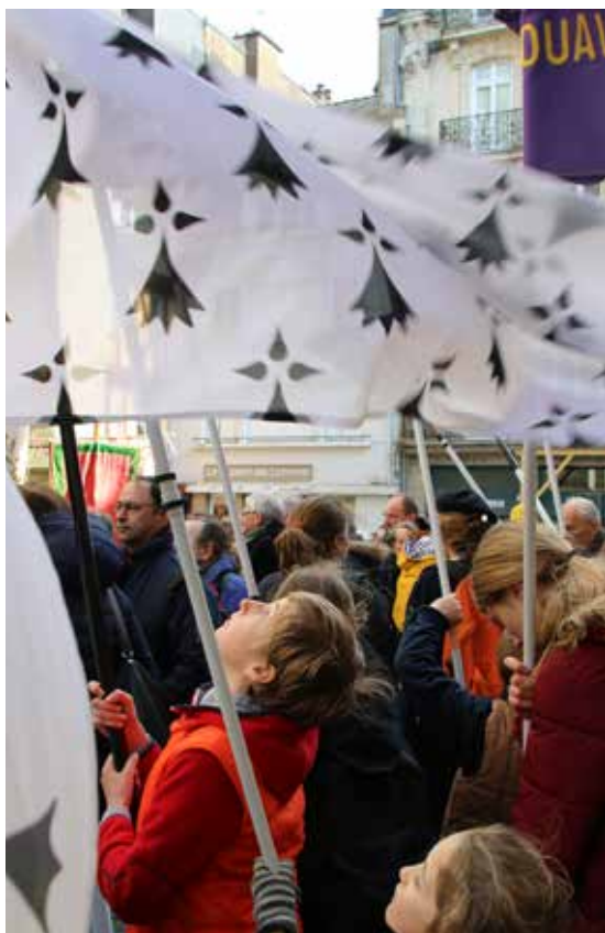
Procession des bannières, ouverture du jubilé, 18 mars 2018.

missionnaire manquerait alors de profondeur dans ses motivations et serait probablement vaine.