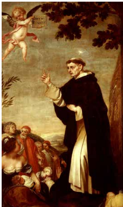
Saint Vincent Ferrer prêchant sur la crainte de Dieu.