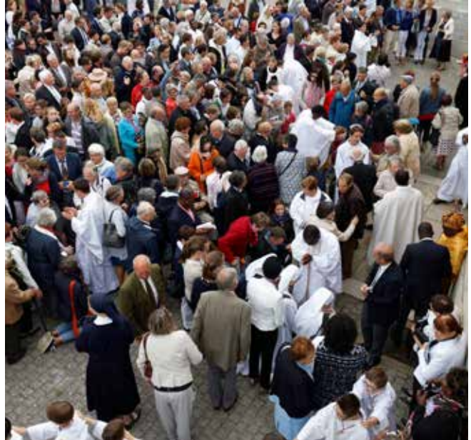
Ordinations sacerdotales, juin 2016. Bénédiction sur le parvis.

nous rappelle l'urgence de la mission. La mission est la réponse de l'Église au commandement de Jésus : « Allez dans le monde entier et proclamez l'Évangile à toutes les nations 22 ». Cette injonction faite aux Apôtres suit leur rencontre avec le Christ Ressuscité. Il s'agit d'une rencontre personnelle au cours de laquelle le Seigneur renouvelle la foi de Thomas 23 et demande à Pierre s'il l'aime 24 . Saint Vincent Ferrer a fait cette rencontre, le 3 octobre 1398 en Avignon. C'est cette rencontre qui a donné une nouvelle impulsion à sa vie. Évangéliser, c'est témoigner de la présence du Christ Ressuscité au cœur de notre monde et surtout au cœur de notre vie. Si nous sommes chrétiens, ce n'est pas seulement parce que nos parents nous ont fait baptiser mais parce que nous avons le désir de suivre le Christ.