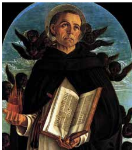
Saint Vincent prêchant l'Apocalypse. Perpignan.

L'annonce des fins dernières permet de jeter un rayon de lumière sur le mystère de et du mal dans vies. Non seulement ils coexistent comme nous le montre la parabole du « bon grain et de l'ivraie 67 ». Dans le monde, l'œuvre du mauvais s'oppose à la venue du Royaume et se mêle à la Parole pour brouiller la compréhension : « Le monde 68 ».