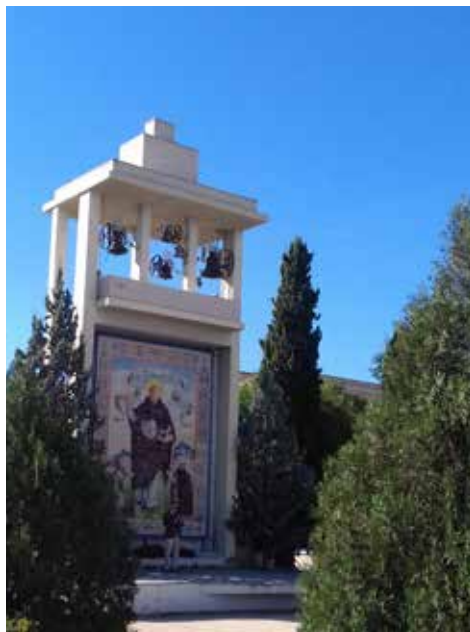
Orphelinat impérial Saint-Vincent-Ferrier, Valencia, Espagne

L'enseignement du Christ sur les fins dernières culmine dans la finale du vingt-cinquième chapitre de l'évangile de saint Matthieu 77 , où le Juge loue ceux qui se sont engagés en faveur « du plus petit d'entre ses frères », tandis qu'il blâme ceux qui ne l'ont pas fait. Il place à sa droite les premiers, leur donnant en héritage le Royaume préparé pour eux depuis la fondation du monde, tandis qu'il place à sa gauche les seconds avant de les envoyer dans le feu éternel préparé pour le diable et ses anges ; car le Christ s'identifie