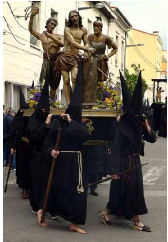
Procession du Vendredi Saint à Perpignan.

lieu du supplice. Les membres de cette confrérie passeront la dernière nuit avec eux et les escorteront, revêtus de la même robe, le visage recouvert de la même cagoule, si bien que jusqu'au moment de l'exécution, personne ne pourra identifier le condamné au milieu de ceux qui l'accompagnent. Chaque Vendredi Saint, la confrérie accompagnait en procession le plus illustre des condamnés à mort sur son chemin de Croix jusqu'au Calvaire. Comme l'orphelinat de Valence, cette confrérie existe toujours. Ses membres se vouent à des œuvres caritatives, notamment la visite des prisonniers, et ils maintiennent chaque année la procession du Vendredi Saint qui rappelle les origines et le but de leur fondation.