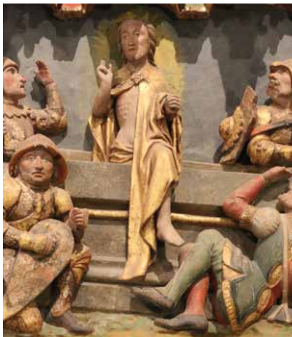
La résurrection - Église Notre-Dame-de-la-Houssaye, Pontivy.