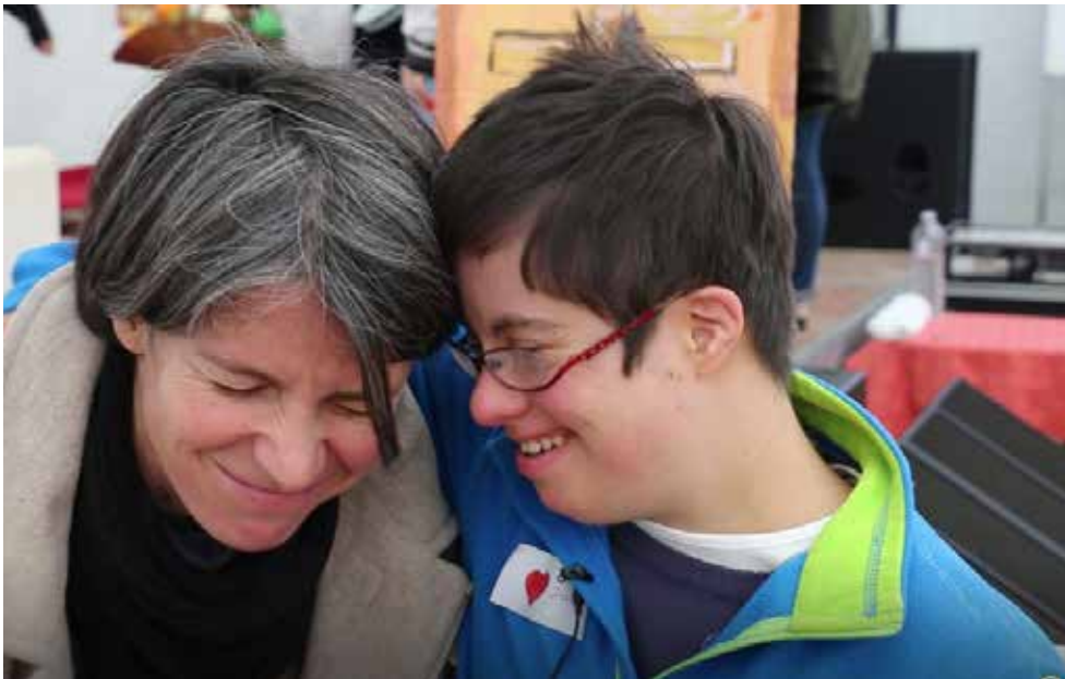
Association La Belle Porte, Auray.

supérieur, cèdent plus facilement le pas à l'individualisme et l'intérêt particulier exclusif. La première victime d'un monde sans Dieu, c'est l'homme 84 ». Les différents acteurs de la solidarité sont ainsi appelés à unir leurs efforts, à se stimuler mutuellement et à s'enrichir réciproquement de leurs expériences respectives, les communautés chrétiennes à être attentives à la vie fraternelle. L'exercice de la charité n'est pas réservé à des mouvements spécialisés sur lesquels nous pourrions nous décharger de notre responsabilité. C'est toute l'Église qui est servante et chaque chrétien qui doit être attentif aux autres pour vivre une charité de proximité.