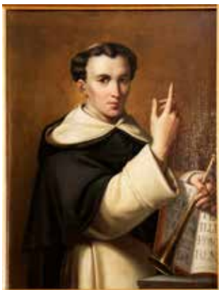
Saint Vincent prêchant sur les fins dernières.

Le 22 novembre 1399, le père Vincent Ferrier, âgé de 49 ans, quitte la cité papale d'Avignon et commence sa nouvelle mission. Le XIV e siècle se termine, le XV e commence. L'Europe déchirée par le schisme souffre de la décadence de l'autorité ecclésiastique, la Guerre de Cent Ans se poursuit, la faim et les épidémies ravagent les populations, l'ignorance donne le champ libre à toutes sortes de superstitions et de doctrines extravagantes. C'est dans cette atmosphère de fin des temps que Vincent Ferrier commence sa mission évangélicatrice.