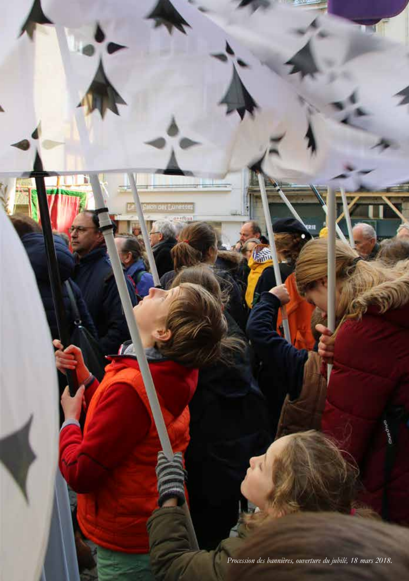
Procession des bannières, ouverture du jubilé, 18 mars 2018.