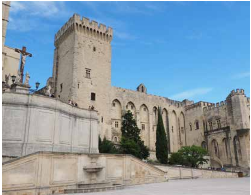
Palais des papes - Avignon

Clément VII meurt le 16 septembre 1394 et, le 28 septembre, le Cardinal Pedro de Luna est élu pour lui suc-