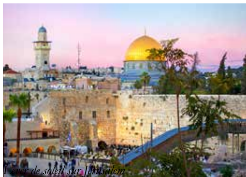
Lever de soleil sur Jérusalem.

Même si nous avons parfois le sujet général de tel ou tel de ses sermons, aucun texte complet de ceux qu'il a prononcés en Bretagne ne nous est