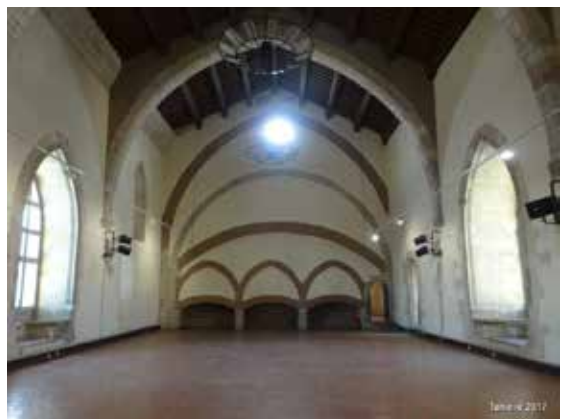
Salle royale dans laquelle Benoît XIII et l'Empereur Sigismond se sont rencontrés.