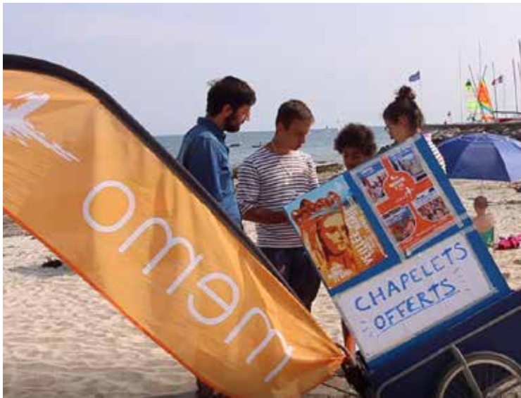
Évangélisation des missionnaires Memo (Mission étudiante en Morbihan) sur la plage.

Le troisième éclairage que saint Vincent Ferrier nous apporte par sa manière de conduire la mission, c'est que l'on ne peut pas évangéliser tout seul.