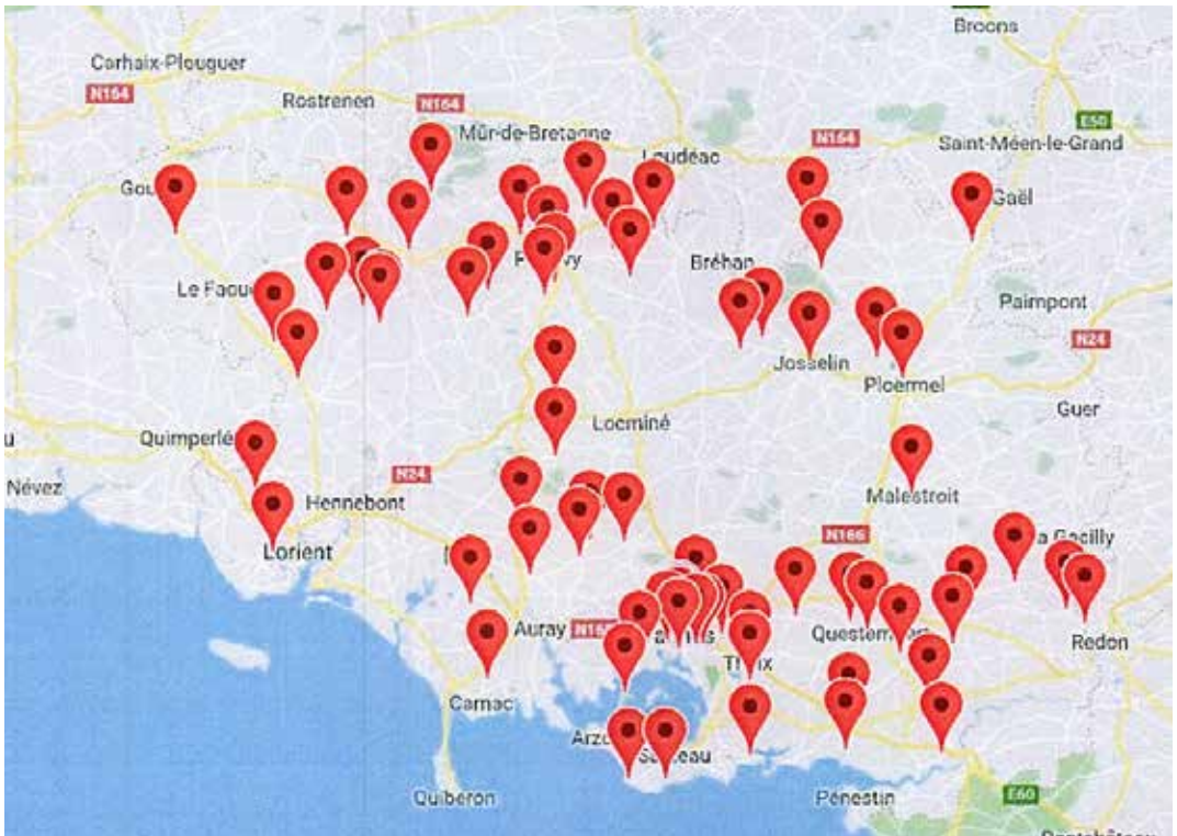
Les passages de saint Vincent Ferrer ou les lieux de cultes dédiés dans le Morbihan.

Il passa chez nous la dernière année de sa vie, exerçant son apostolat de missionnaire itinérant dans toute la Bretagne.