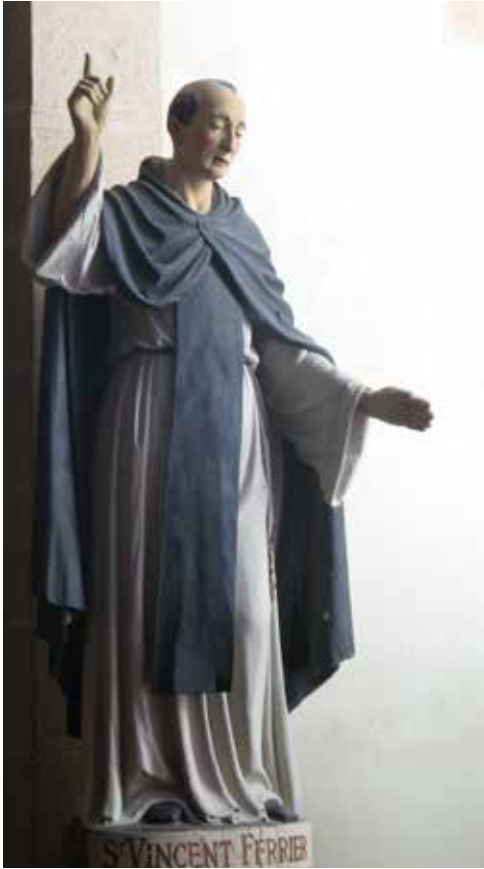
Saint Vincent prêchant. Église d'Arradon.

ni couteau ... les émeutes que les chrétiens font contre les juifs, ils les font contre Dieu lui-même. Les juifs doivent venir d'eux-mêmes au baptême ...» Il serait bien évidemment anachronique de parler ici de liberté religieuse. Vincent croit en la nécessité de la conversion pour obtenir le salut, mais sa démarche respecte les droits de la conscience, le rôle de la prédication est de l'éclairer suffisamment pour qu'elle fasse le bon choix. Il prêche pour sauver les âmes. C'est à cette tâche qu'il consacre sa vie.