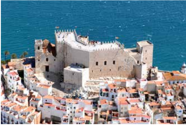
Château de Peñíscola

au château de Peñíscola, près de Valence, où il mourra sept ans plus tard, plus que nonagénaire, toujours persuadé de sa légitimité et sûr que son bon droit avait été injustement bafoué. Le schisme était terminé. Le conclave qui se tient à l'ombre du Concile de Constance élira le pape