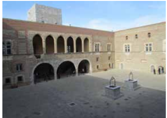
Palais des rois de Majorque - Perpignan

Mandaté par le Concile de Constance, l'Empereur marche sur l'Aragon