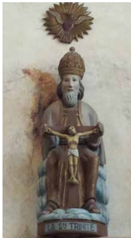
La Trinité. Église de Kernascleden.

Cette unité, c'est la nature même de l'Église : elle puise son existence au cœur même de la Trinité, au cœur de l'amour du Père pour le Fils, et du Fils pour le Père, amour dont procède l'Esprit.