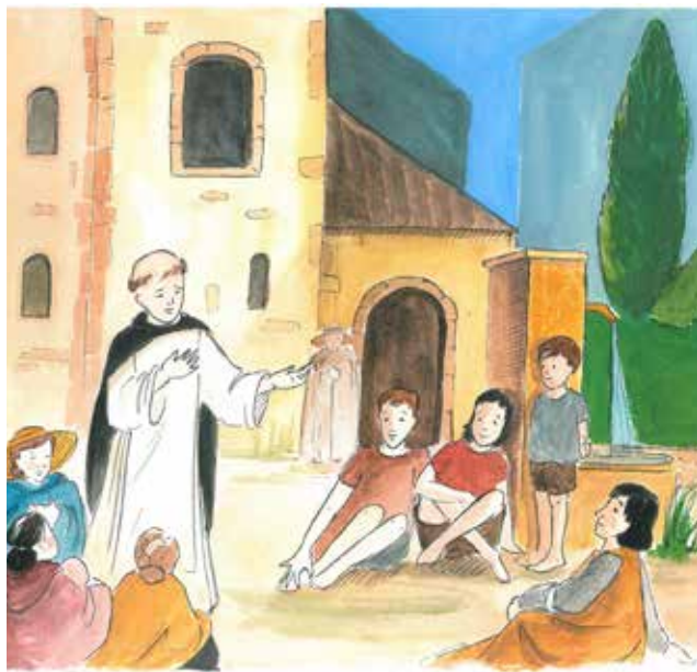
Apôtre de la paix. Vie de saint Vincent Ferrier.

Une fois la prédication terminée, le saint descend de son estrade et se livre à un véritable bain de foule ; on l'approche, on le touche, certains coupent un morceau de sa cape ou de son scapulaire pour emmener avec eux, outre les impressions de ses propos, un souvenir de lui, une relique dont on espère quelque miracle. Les vêtements lui ayant appartenu sont en effet réputés miraculeux depuis qu'au couvent de Collioure, un frère