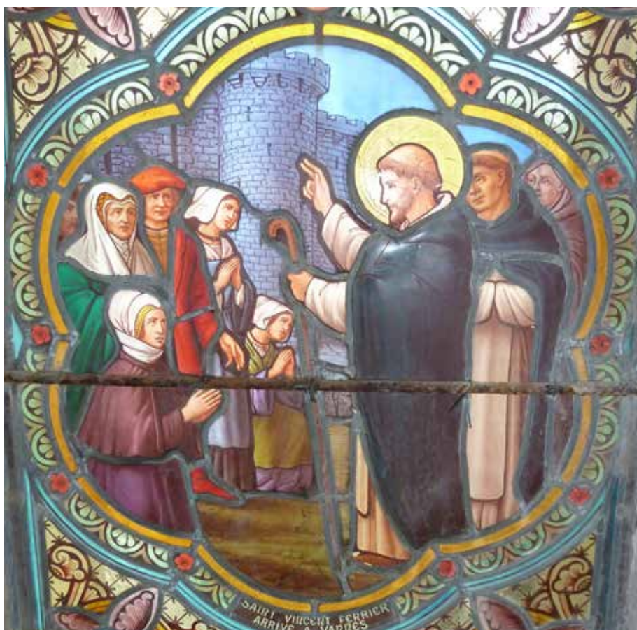
Vitrail de l'ancienne chapelle Saint-Paul, Vannes.

À la fin du mois de décembre, Vincent Ferrer arrive à Angers où il séjourne un mois au couvent des dominicains. Il est désormais aux portes de la Bretagne. Le 8 février 1418, il arrive à Nantes, il y reste une vingtaine de jours. La route vers Vannes, où l'attend le Duc, est désormais tracée, Guérande, Redon, Questembert.