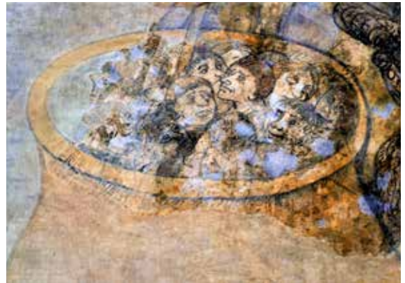
Fresques, église Notre-Dame - Kernascléden

Face au scandale du mal, aujourd'hui comme dans le