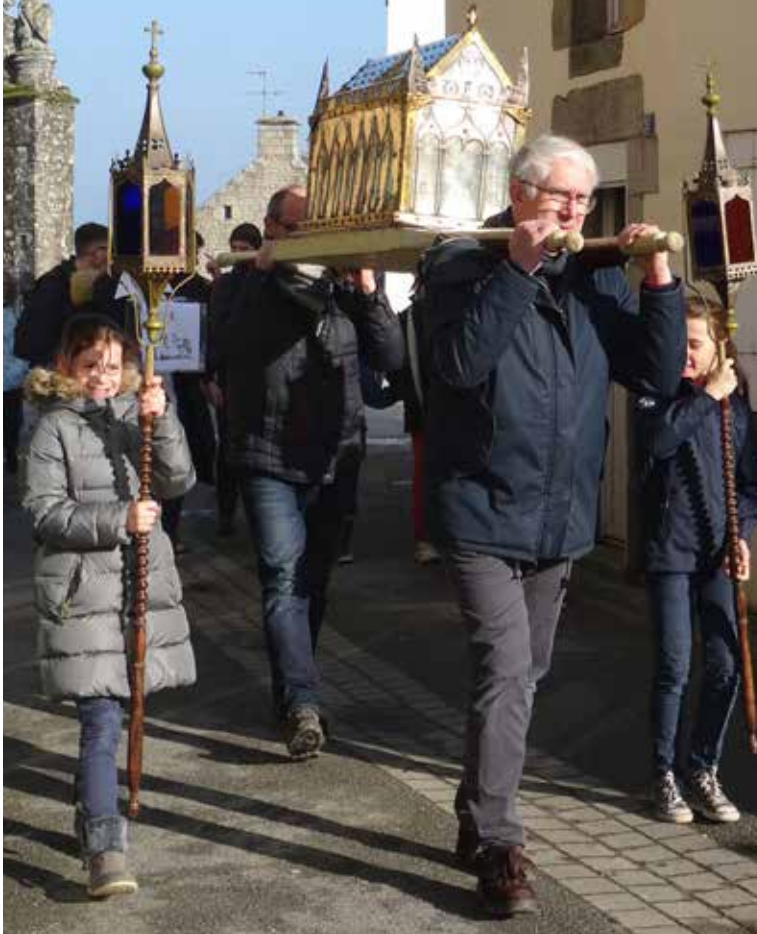
Ouverture du jubilé Saint-Vincent-Ferrier, 18 mars 2018.

P armi les éléments de la vie de saint Vincent Ferrier, un de ceux qui nous interpelle le plus aujourd'hui me semble être son engagement sans faille au service de la mission. À l'heure où le pape François nous invite à revisiter la Nouvelle Évangélisation à la lumière de la Joie de l'Évangile, saint Vincent Ferrier