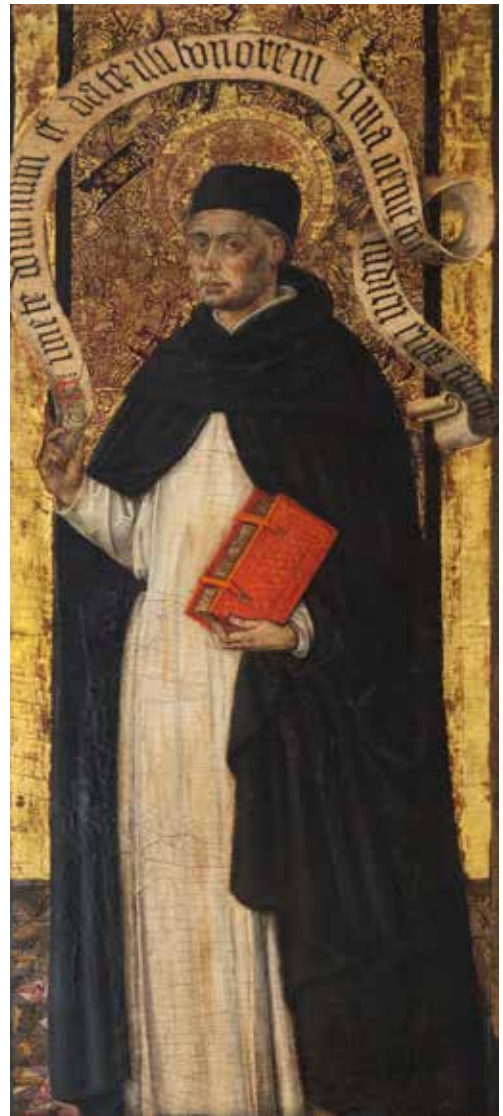
Cathédrale de Valencia

Saint Vincent Ferrer avait compris qu'elle ne peut remplir cette double mission qu'en donnant le témoignage de sa propre conversion et de sa propre unité, en travaillant à établir la paix entre les hommes. Pendant toute sa vie il a été, à travers l'Europe, un ardent Apôtre de la Paix : il a apaisé les luttes des grandes familles féodales de Valence, il a contribué à établir l'unité des Espagnes par le compromis de Caspe. Sa venue en Bretagne à la demande du Duc Jean V et sa rencontre avec le roi d'Angleterre à Caen n'eurent pas d'autre but que de travailler à l'établissement de la paix. Mais sa conversion lui avait fait comprendre que cette œuvre diplomatique et politique, si elle était nécessaire, n'était pas suffisante. La paix ne se limite pas à « la pure absence de guerre et elle ne se borne pas à l'équilibre des forces adverses 54 ». La paix terrestre naît de l'amour du prochain 55 , d'où la nécessité de prê-