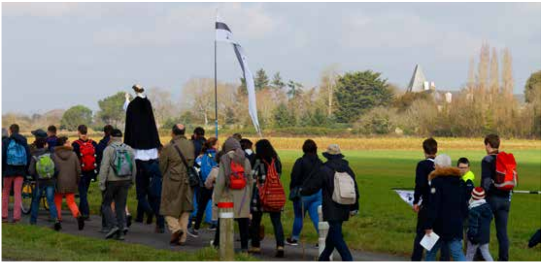
Pèlerinage d'ouverture du jubilé, de Theix à Vannes, 18 mars 18.

L'Évangélisation suppose la logique du don de soi plus que la richesse des moyens utilisés. C'est en ce sens que le Pape François appelle de ses vœux