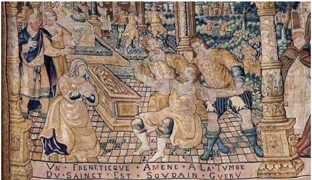
Tapisserie des miracles de saint Vincent Ferrer, 1615. Cathédrale de Vannes.