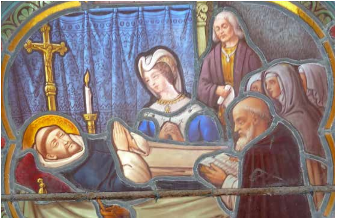
Vitrail de l'ancienne chapelle Saint-paul, Vannes.

Si nous voulons, tout au long de cette année jubilaire, faire mémoire de saint Vincent Ferrer, ce n'est pas seulement par intérêt pour l'histoire de notre diocèse et pour l'œuvre qu'il y a jadis accomplie. L'exemple de sa vie, sa rencontre personnelle avec le Christ, son engagement au service de la mission, son œuvre diplomatique au service de la paix, son amour de l'Église et sa passion pour son unité, son amour des pauvres et son désir de soulager les souffrances doivent être une source d'inspiration pour nous aujourd'hui.