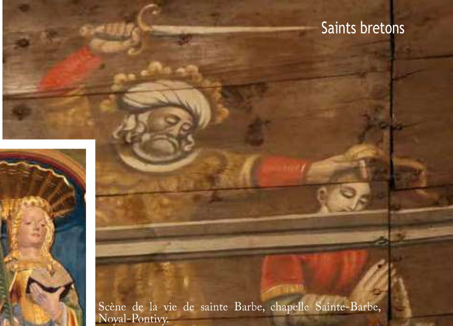
Scène de la vie de sainte Barbe, chapelle Sainte-Barbe, Noyal-Pontivy.