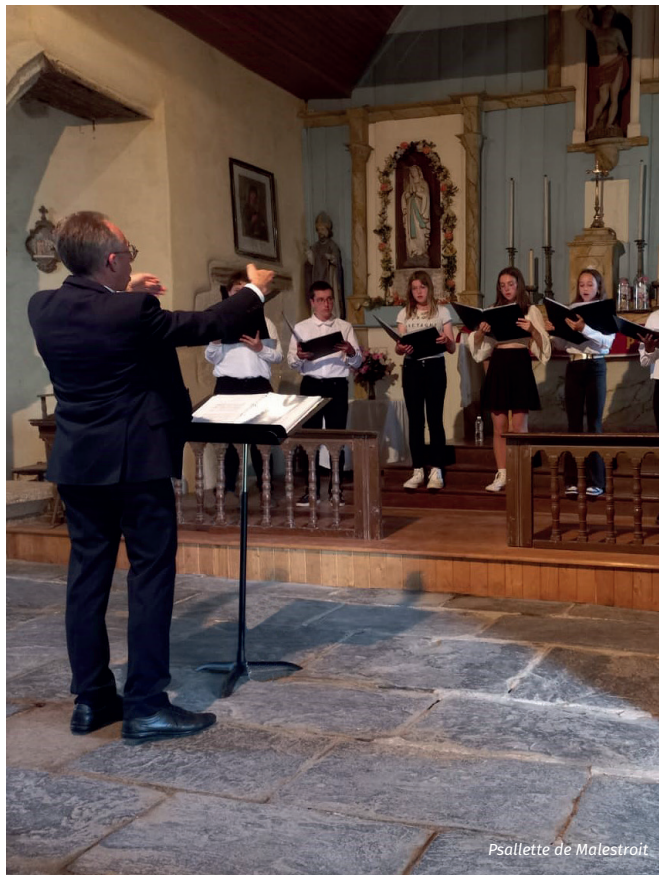
Psallette de Malestroit.