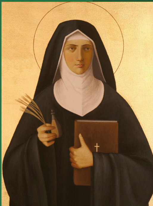
Sainte Hildegarde de Bingen