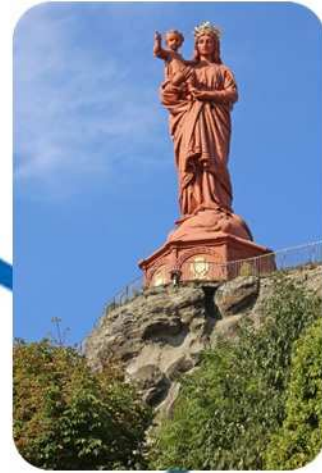
Notre Dame du Puy