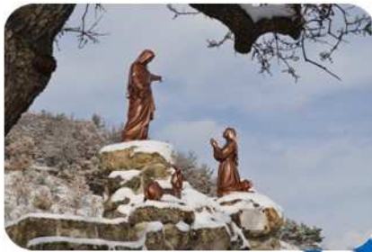
Notre Dame du Laus