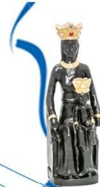
Notre Dame de Rocamadour