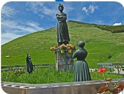
Notre Dame de la Salette