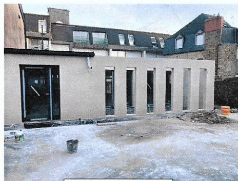
Côté arrière (patio)