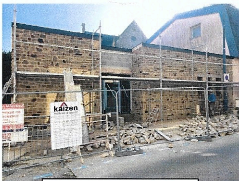
Côté rue Bourdeloy (entrée)