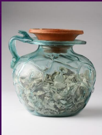
URNE FUNÉRAIRE GALLO-ROMAINE (MUSÉE D'AURILLAC)