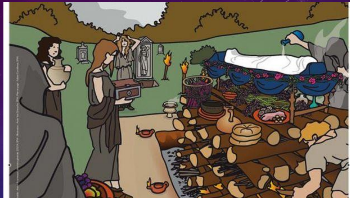
Reconstitution d'une incinération aux temps des romains