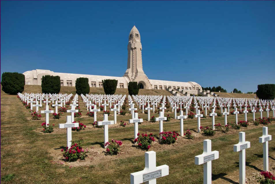
Cimetière militaire de Douaumont